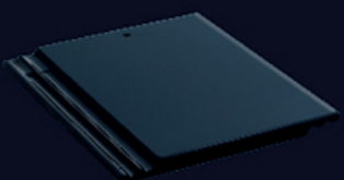
Excella Modern Series

ขนาด 34.5x42 ซม./แผ่น น้ำหนัก 3.7 กก./แผ่น จำนวนการใช้งาน 10.5 แผ่น/ตร.ม. ระยะห่างของแป 32.5-33.5 ซม. ความลาดชันของหลังคาที่แนะนำ 25-40 องศา